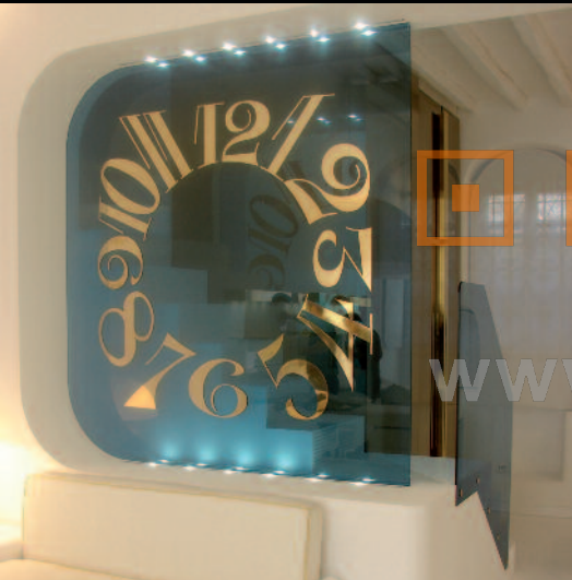
LED SHOWROOM FRANK MULLER [MYKONOS] PROJECT - CHERUBINI GROUP [ITALY]

При необходимости проектный отдел компании может реализовать прототипы. Изделия, изготовленные на заказ, испытываются в наших лабораториях в соответствии с действующим законодательством.