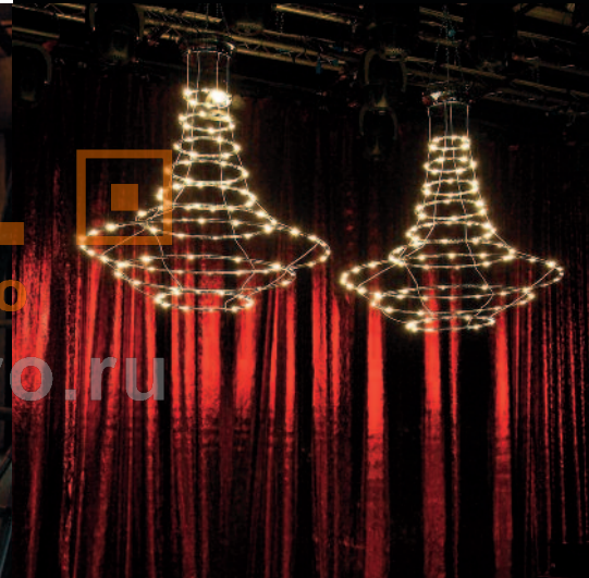
MUSE TV SHOW - MARKETTE [LA7 - ITALY]