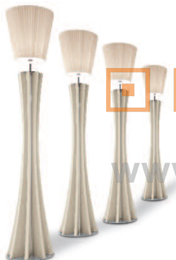
AD HOC SPECIAL PRODUCTION FOR SOMASCHINI MOBILI [CABIATE]

Ausführungen der Metallteile, Farbgebung der LEDs, Linsen und Veränderungen der Rahmengröße. Bei Anfragen nach Sonderartikeln, die zu den in diesem Katalog aufgeführten Produkten keine Beziehung haben, steht Ihnen unser technisches Büro für Analysen und Machbarkeitsstudien zur Verfügung. Unsere interne Planungsabteilung kann für Sie auf Anfrage Prototypen herstellen. Die hergestellten Sonderprodukte werden in unseren Labors getestet, um die gesetzlichen Bestimmungen zu erfüllen.