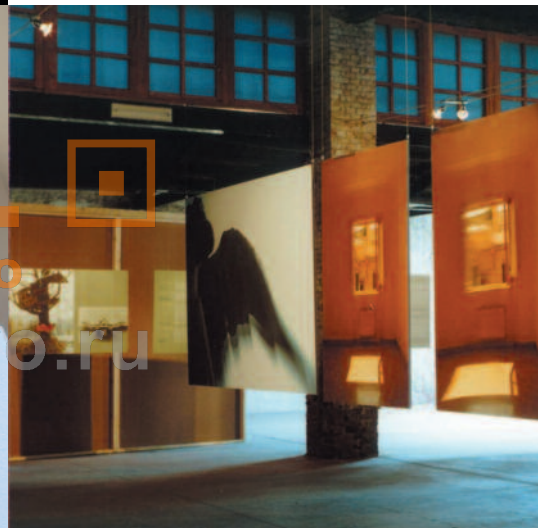
EOS EVENT - LA CASA DELL'ANGELO [MILANO]

El potencial de Metal Spot se completa con la posibilidad de desarrollar con la máxima flexibilidad productos modificados a partir de nuestros estándares o realizados completamente a medida, para afrontar las exigencias del sector Contract.