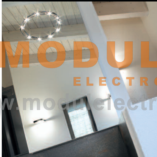
MUSE SPECIAL PRODUCTION FOR PRIVATE [NEW YORK]